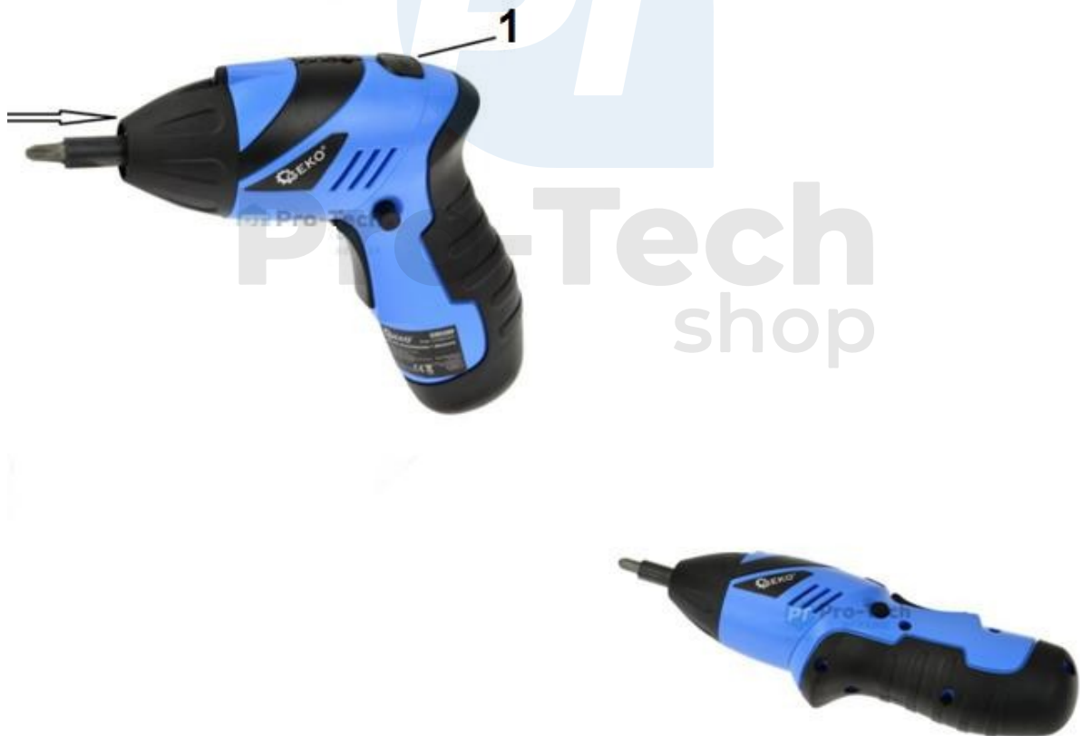
1. Buton de aliniere cu șurubelniță

Dacă lucrați în zone cu probleme sau doriți să găuriți, apăsați butonul și nivelați mânerul în sensul acelor de ceasornic. Acum puteți folosi șurubelnița ca o riglă.